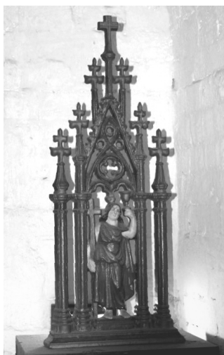
Rys. 1. Figura św. Barbary w Zabytkowej Kopalni Węgla Kamiennego GUIDO w Zabrze.