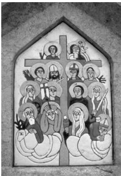
Rys. 4. Czternastu Świętych Wspomożycieli.