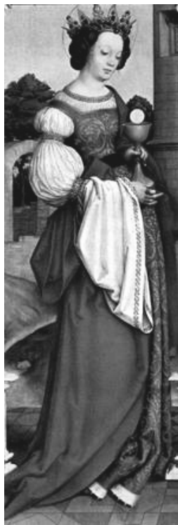
Rys. 5. Święta Barbara w wyobrażeniu Hansa Holbeina Starszego