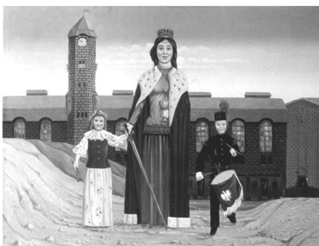
Rys. 2. Wyobrażenie świętej Barbary Erwina Sówki

Fig. 1. The statue of St. Barbara in the historical coalmine in Zabrze.