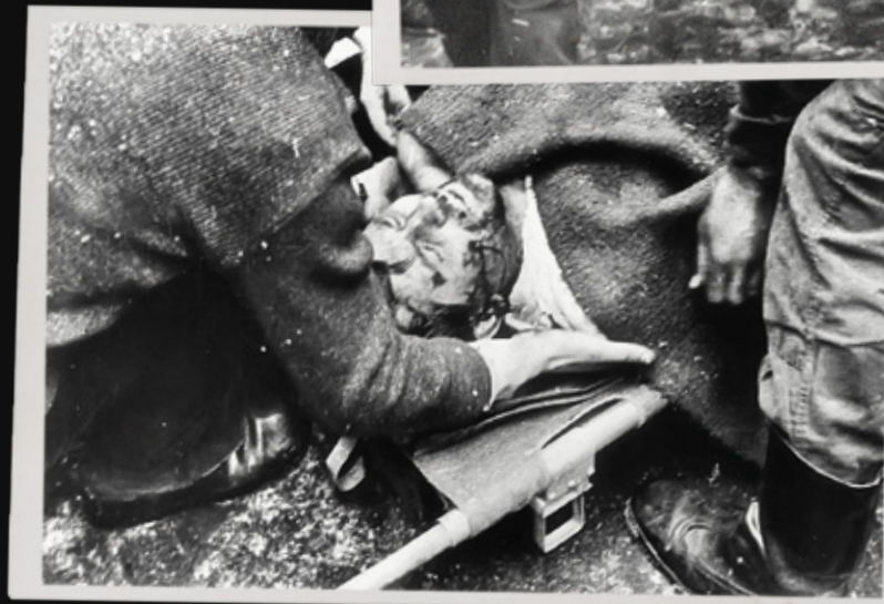
Pacyfikacja kopalni „Wujek” w Katowicach, 16 grudnia 1981 r.