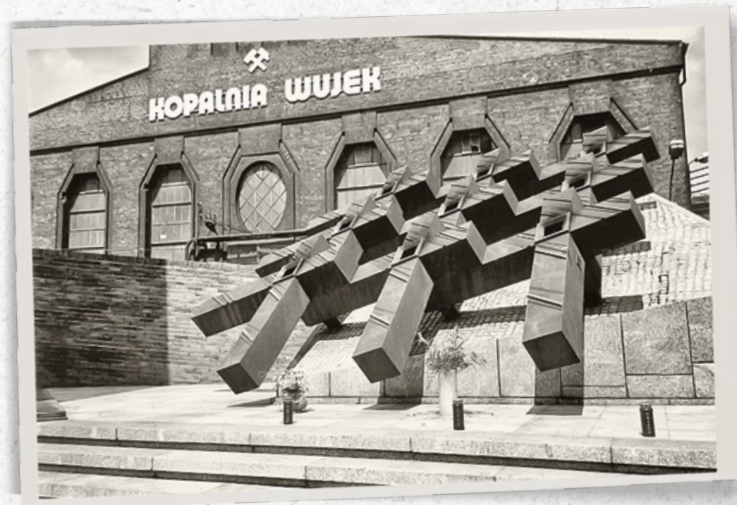
Zdjęcie kopalni „Wujek”

W dziesiątą rocznicę stanu wojennego w 1991 r. przy ul. Wincentego Pola w Katowicach odsłonięto Pomnik ku czci górników kopalni „Wujek” poległym 16 grudnia 1981 r. Dnia 29 sierpnia 1990 r. zostali oni pośmiertnie odznaczeni przez prezydenta RP na uchodźstwie Ryszarda Kaczorowskiego Złotym Krzyżem Zasługi z Mieczami, 7 grudnia 1992 r. – przez prezydenta RP Lecha Wałęsę – Krzyżem Kawalerskim Orderu Odrodzenia Polski, w 2016 r. – przez prezydenta RP Andrzeja Dudę – Krzyżem Wolności i Solidarności.