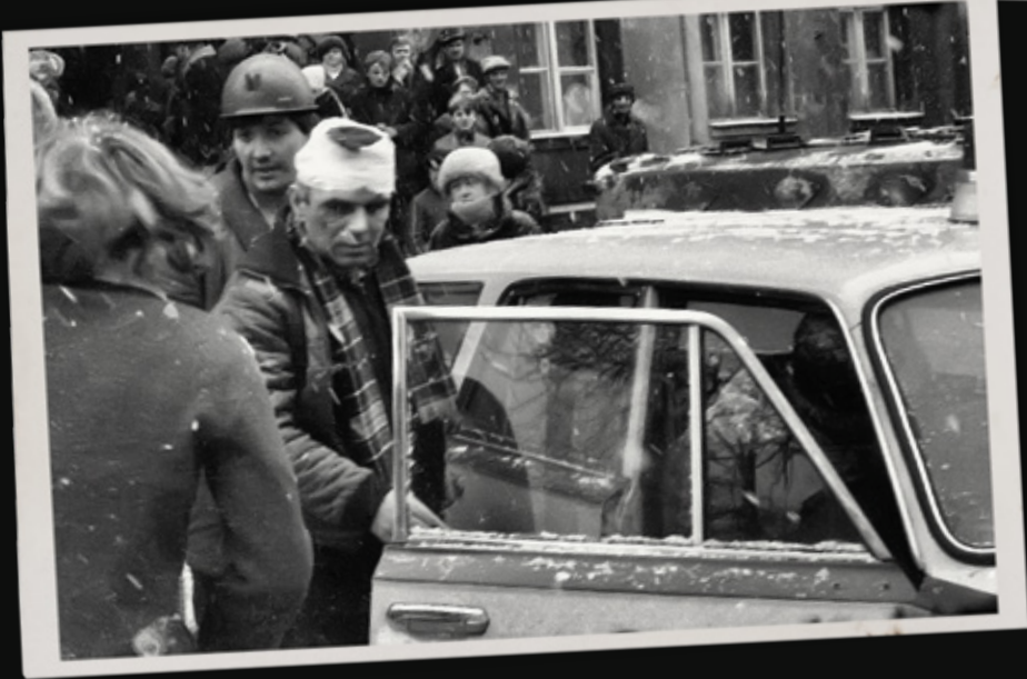
Pacyfikacja kopalni „Wujek” w Katowicach, 16 grudnia 1981 r.

gdy milicjanci przystępowali do 2 i 3 natarcia lub cofali się pod naporem górników, ale zawsze mieli możliwość opuszczenia kopalni bądź to drogą wewnątrzzakładową, bądź wyłomami uczynionymi w ogrodzeniu. W ostateczności, członkowie BCP [Batalion Centralnego Podporządkowania ZOMO – przyp. Z.Sz.] – jak już wcześniej Sąd nadmienił – zawsze mieli możliwość przeskoczenia przez mur, jak to czynili funkcjonariusze plutonu specjalnego. Nigdy też nie doszło do odcięcia jakiejś grupy milicjantów w zaułku przy magazynie odzieżowym, a strzały zostały oddane z całkiem innego powodu, tj. by przeciwdziałać panice i bezładnej ucieczce funkcjonariuszy BCP oraz by wreszcie przełamać zacieklej opór górników”.