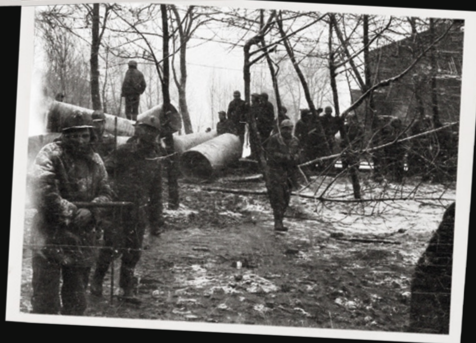
Pacyfikacja kopalni „Wujek” w Katowicach, 16 grudnia 1981 r.