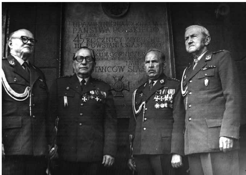
Powstańcy +Śląscy przy tablicy pamiątkowej, 1966.

miono w roku szkolnym 1953/54 warsztaty szkolne, w których uczniowie nabywali praktyczne umiejętności zawodowe. Początkowo był to barak, gdzie było 50 stanowisk szkoleniowych dla uczniów klas I. W warsztatach uczniowie zapoznawali się z ręczną obróbką drewna, robotami ciesielskimi i pracami ślusarskimi. Zajęcia praktyczne odbywały się też w kuźni kopalnianej, warsztacie elektrycznym, lampowni oraz w stacji ratownictwa górniczego. Praktyczna nauka zawodu odbywała się pod kierownictwem doświadczonych instruktorów – byli to najczęściej emerytowani szytgarzy.