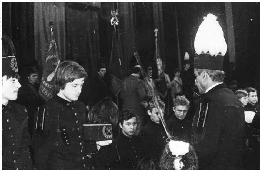
Pasowanie na górnika.

otrzymała drugi budynek po hotelu robotniczym kopalni „Wujek” z przeznaczeniem na internat dla zamiejscowych uczniów. Tam także znalazły pomieszczenia: biblioteka, sala teatralna, świetlica i uczniowska przychodnia lekarska.