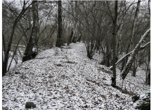
54. Widok kolejki blisko ulicy Leśnej.