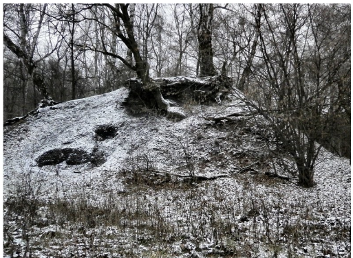
56. Hałdy przy ulicy Leśnej.