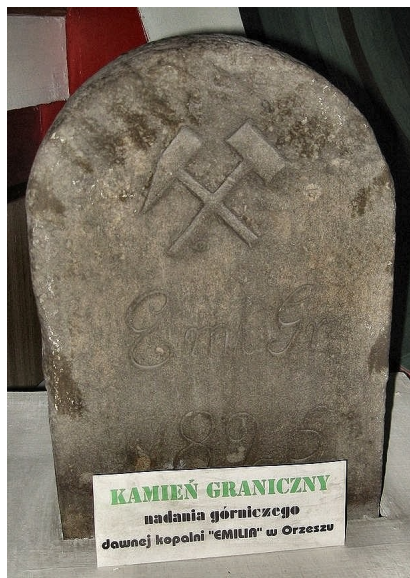
20. Kamień graniczny kopalni założony w następnym roku po uzyskaniu nadania.