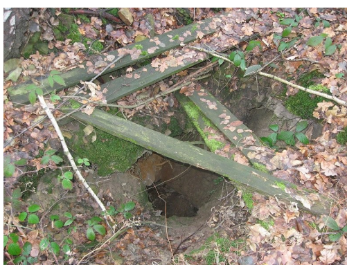
21. Sztolnia „dolna” widok współczesny. U góry wylot sztolni, z lewej wnętrze, powyżej świetlik.